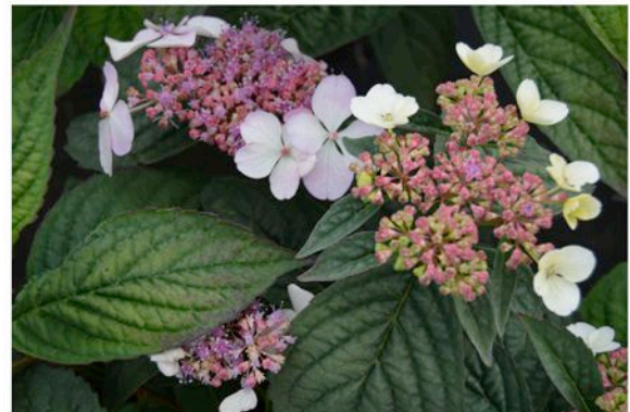
Sorte 'Bluebird' mit zahlreichen hier bereits aufgeblühten fertilen Blüten in der Mitte

Verwendung: Die zierlichen Sorten mit tellerförmigen Blüten wirken naturhafter und weniger künstlich als die großblütigen Sorten von H. macrophylla und lassen sich einfacher und verträglicher in viele Gartenbilder integrieren. Sie sind eine gute Ergänzung in Rhododendron-Pflanzungen, weil diese Gartenbereiche durch die spätere Blüte (ab zirka Juli) beleben.